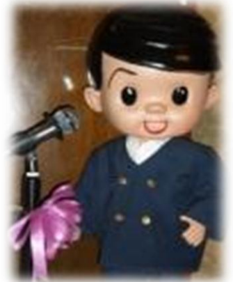
イメージキャラクター 御堂筋太郎

これから年末にかけて、なにかとお集まりが増えますが、ちょっと面白い、目先が変わった、そしてなにより温かい雰囲気のお店を!とお考えの時に思い出して頂くと大変嬉しいです。